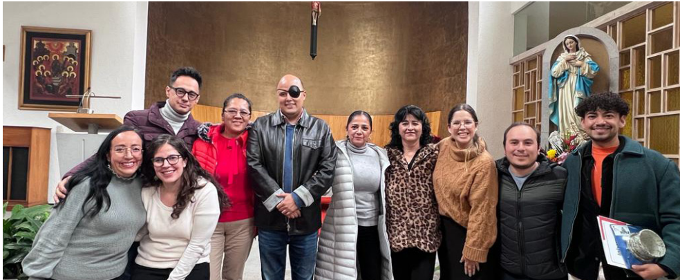
Celebrando los Pasos Marcados: Un Homenaje a la Trayectoria del Personal

En el marco de nuestra festiva comida navideña, nos deleitamos no solo con la alegría de la temporada, sino también con un momento especial para honrar las historias y trayectorias de algunos miembros del Inhumyc.